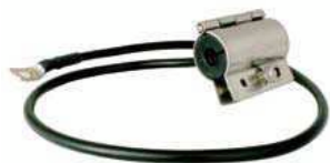
Erdungsschelle für Aircell®7, Art.-Nr. 6811

Bedingt durch Fertigungstoleranzen kann der Verlauf der Rückflussdämpfung variieren! Einzelne Spitzen sind unkritisch!