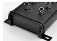
Halterungen zum Anschrauben