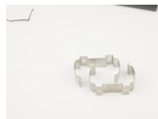
Befestigungsclips für Trägerplatte